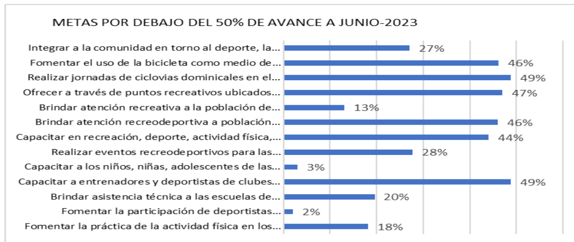
Gráfico No.2- Metas por debajo del 50% de avance a junio-2023 Elaboración propia

Así mismo, se evidencian programas que, al primer semestre de la vigencia, sus indicadores están por debajo del 50% de ejecución. En este sentido, se recomienda revisar estas metas analizando las causas y planteando a tiempo las acciones necesarias de manera que se cumplan los resultados al cierre del periodo.